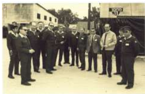
סגל א' מצל"ח בשנת 1972