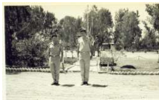
מפקד מצל"ח יצחק ילון וסגנו באותה עת מאיר ניצן בטקס יום העצמאות