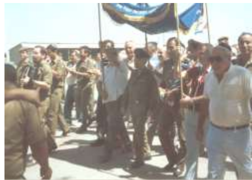
חנוכת בית הכנסת בבסיס שקמה