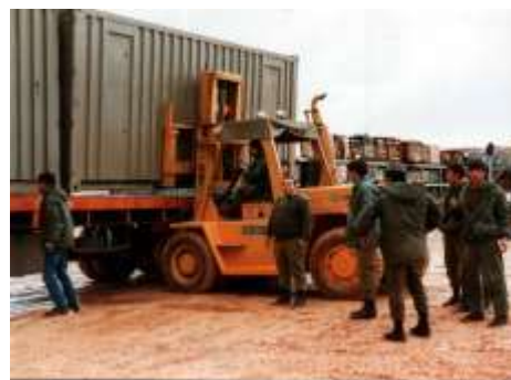
שלוחת מצל"ח במרג' עיון