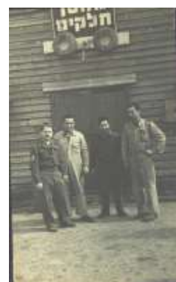
מחסני חיל התחבורה בצריפין, 1949