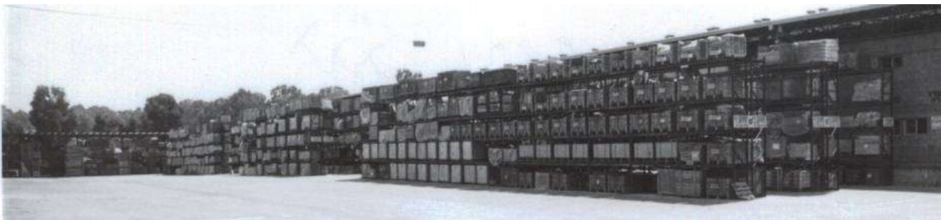
אחסנת חוץ בבה"חים לפני הפעילות למיגור

בסוף שנות ה-90 החלה פעילות נמרצת לצמצם למינימום את מופעי החסנת החוץ בבסיסי מצל"ח מתוך ההכרה והתובנה שפריט שמצוי תחת כיפת השמיים וחשוף לתנאי האקלים המשתנים מתבלה באופן מואץ ובלתי נמנע. לפעילות זו היו שותפים כלל גורמי מצל"ח, הן הענפים הרוכשים שקבעו אבחנה בין תנאי ההחסנה הנדרשים מכל פריט ומדיניות לגרירת פריטים שאינם נדרשים ותופסים נפח אחסנה יקר ובעיקר פעילות מאומצת מצד בסיסי ההחסנה כדי ליישם מגמה זו הלכה למעשה. פעילות זו נמשכה מספר שנים אל תוך שנות האלפיים ואת תוצאותיה ניתן לראות היום בשטח.