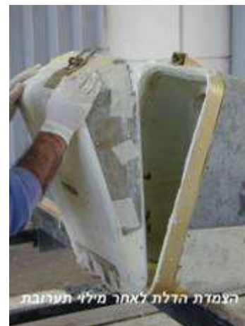
תיקון מארזי תחמושת בבימ"ל הרדוף בבית שאן