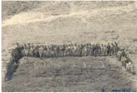
טיול של בה"ח 687 לדרום הארץ, 1953