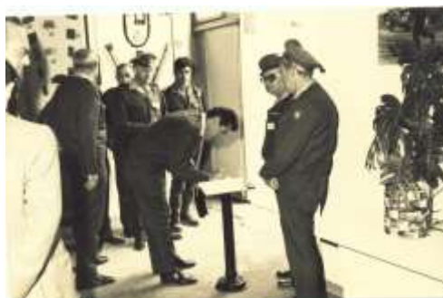
הרמטכ"ל דוד אלעזר (דדו) חותם בספר המבקרים בתערוכת הייצור המקומי בשנת 1972