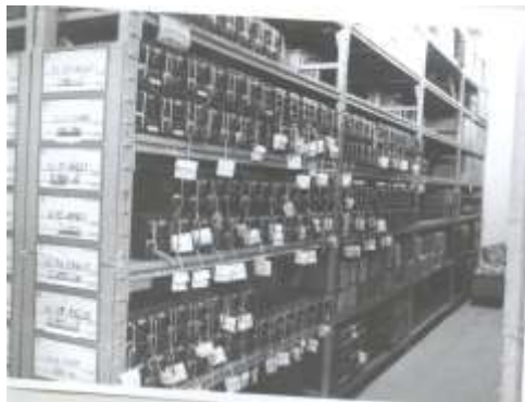
מחסן בבסיס הקשר בשנות ה-80

בבה"חיים הוקמו מחלקות דחיפה. כמות כ"א במצל"ח ירדה בעשור זה בכ- 800 איש. בחציו הראשון של העשור הוקמו מחסני 4000 מ"ר בכל הבה"חיים, מחסני 2700 מ"ר, מחסני ציוד אופטי ומערכות שינוע. בבסיס הקשר הוקם מחסן 46 שהפך למחסן המרכזי בבסיס זה. בבסיס שורה הוקם מחסן אופטיקה עם בקרת לחות אוטומטית ומחסן דומה הוקם גם בנטפים. בתקופה זו החלו לשמור סוללות אלקליין במכולות קירור. בחציו השני של העשור לא נוספו מבנים חדשים אלא שופרו תשתיות במבנים ישנים בתחום החשמל, הבינוי והתקשורת. במהלך העשור פונו בסיסי משנה חולון ואשדוד.