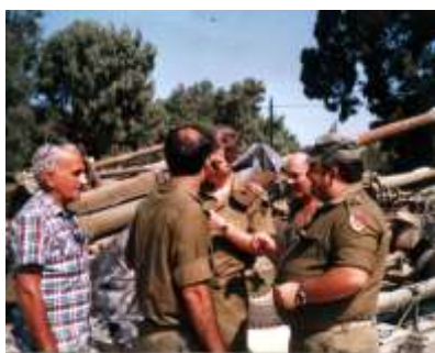
אנשי מצל"ח בלבנון

במלחמת שלג נדרש מצל"ח ובעיקר בה"ח 6810 למאמצים גדולים לטיפול בכמויות מסיביות של ניפוקי צל"מ וחלפים למערך השדה. הערכות הבה"ח הוכיחה את עצמה ועמדה במבחן המלחמה. בשל התנאים הטופוגרפיים הקשים בהם נע הרק"מ הייתה צריכה מוגברת של חלקי מזקו"מ ואופנים מכל הסוגים. הסדנה עבדה מסביב לשעון כדי לתת מענה לצרכים אלו. מצל"ח תומך בכוחות הלוחמים ע"י הקמת שלוחות בזהרני ובמרג' עיון, ביצוע הספקה בהיטס ופינוי שלל. הוקמו חוליות דחיפה שתפקידן היה להוביל את הציוד עד ליחידות לרמת הטנק והחייל ולהביא חזרה לנטפים ציוד פגוע או נטוש אשר הועבר משם דרומה לצורך שיקומו והחזרתו לכשירות. הפעולה המוצלחת של יחידות אלו הייתה תולדה של יישום לקחי המלחמות הקודמות. יחידת פינוי השלל גויסה ופעלה ללא ליאות להעברת כמויות שלל עצומות לבה"ח תוך שהיא מקבלת ממנו את כל הסיוע הלוגיסטי הנדרש ואף סיוע בכ"א מקצועי לביצוע המשימה. השלל שנאסף היה ציוד בתחום הטנקים, הנגמ"שים, הרכב (כולל מכוניות פרטיות מסוג מרצדס ו-BMW ששימשו יחידות לפעילות מודיעינית), הנשק (לרבות תותח שדה ותותחי נ"מ), מכ"מים, ציוד הנדסי. בתום מלחמת של"ג אורגנה תערוכת שלל ובה ביקרו כ- 200,000 איש. לאחר פירוק התערוכה חזר בה"ח 6810 לשגרה והוקמה מחלקת ההצטיידות בהרדוף.